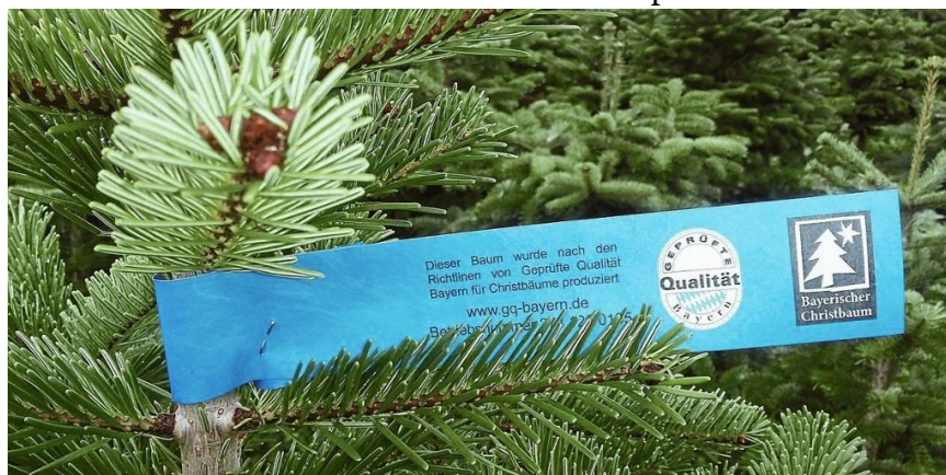
Рождественские ели, выращенные в рамках программы «Geprüfte Qualität — Bayern».

Прежде чем предприятие сможет получить право использовать один из знаков, оно будет тщательно проверено лицензиатом или уполномоченным им органом — пройдет так называемый вводный контроль. Проверяется, соответствует ли продукция хозяйства всем условиям программы. Кроме того, проводится проверка на месте. Если первая проверка окажется положительной, предприятие может использовать знак, что подтверждается свидетельством.