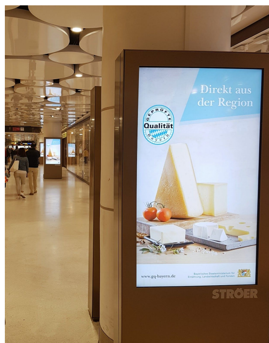
Слева-направо: рекламный плакат на станции метро в Мюнхене, рекламный плакат в торговом центре Мюнхена.

Приобрести продукцию, отмеченную логотипом «Гепрюфте квалитет — Байерн» можно через всех крупных ритейлеров (к примеру, в Германии это EDEKA, Rewe, Lidl, Aldi-SÜD), а продукты, отмеченные био-знаком, также в магазинах органической продукции. Сельскохозяйственное предприятие или фермерское хозяйство может реализовать свою продукцию также напрямую либо услуги по переработке, упаковке и/или реализации могут взять на себя другие хозяйства. Кроме того, продукцию можно приобрести на рынках на развес (без упаковки), так как логистические компании также проходят контроль на соответствие.