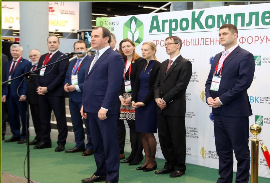
Иван Вячеславович Лебедев – заместитель министра сельского хозяйства России