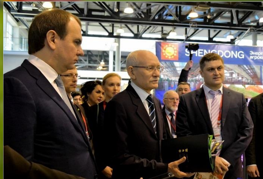
Рустэм Закиевич Хамитов – Глава Республики Башкортостан